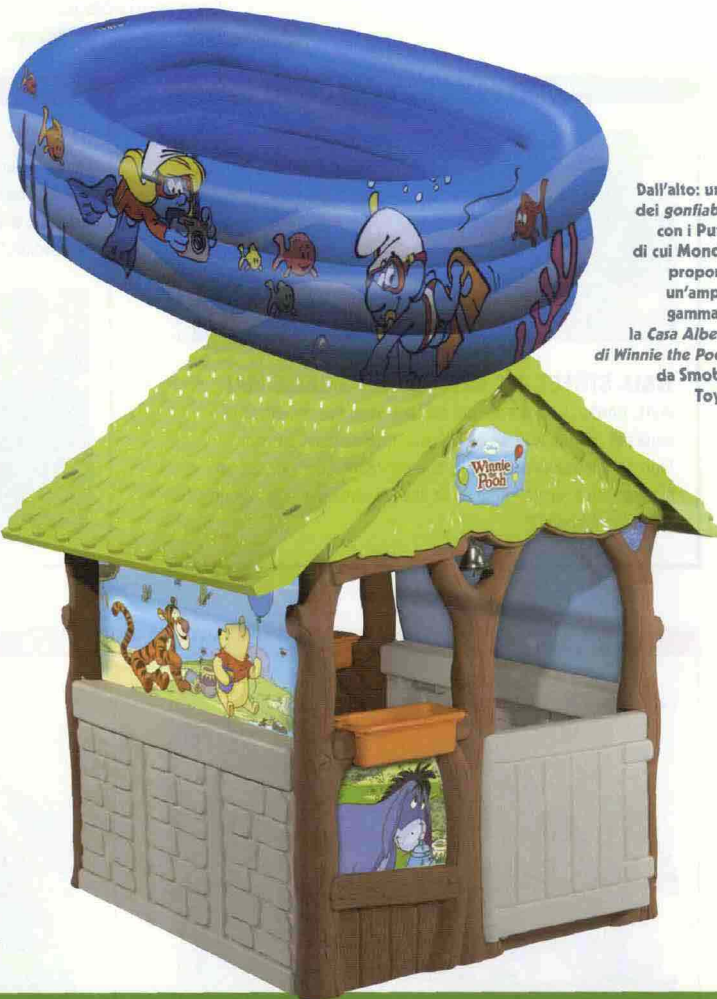
Dall'alto: uno dei gonfiabili con i Puffi di cui Mondo propone un'ampia gamma e la Casa Albero di Winnie the Pooh da Smoby Toys.

S moby Toys avrà un'offerta outdoor ricca di nuovi prodotti per il 2011. My House è una casetta dal design moderno, con tetto con lucernaio, due finestre con persiane, due oblò e un davanzale sul retro. E, per aumentare la giocabilità, dispone di campanello elettrico, serratura funzionante e cassetta delle lettere. Scivolo Dual Garden , in plastica e metallo, ha un base ampia e una scala con maniglioni ergonomici per aumentare stabilità e sicurezza. La discesa misura 170 cm. Altalena Plus ha la struttura in tubolare metallico con seggiolino evolutivo. Adatta a bambini dai 18 mesi in su, ha un'altezza di 180 cm. Dolce Altalena è una baby altalena con seggiolino evolutivo alta 120 cm. Casa Albero Winnie è la casetta di Winnie The Pooh, con due tende in tessuto, due davanzali e campanella in metallo. Facile da assemblare è composta da parti in plastica trattate per aumentare la resistenza e la tenuta dei colori nel tempo. Sweet Home Hello Kitty è una grande casetta con due tende in tessuto decorate Hello Kitty , porticina e cassetta delle lettere. Anche in questo caso, le parti in plastica sono state trattate per rendere il giocattolo più resistente e mantenere i colori inalterati nel tempo (gc).