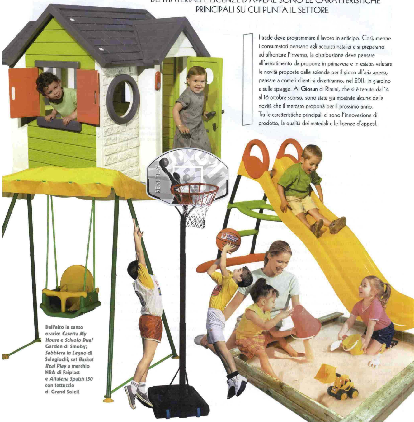
Dall'alto in senso orario: Casetta My House e Scivolo Dual Garden di Smoby; Sabbiera in Legno di Selegiochi; set Basket Real Play a marchio NBA di Faipplast e Altalena Spalsh 150 con tettuccio di Grand Soleil

Il trade deve programmare il lavoro in anticipo. Così, mentre i consumatori pensano agli acquisti natalizi e si preparano ad affrontare l'inverno, la distribuzione deve pensare all'assortimento da proporre in primavera e in estate, valutare le novità proposte dalle aziende per il gioco all'aria aperta, pensare a come i clienti si divertiranno, nel 2011, in giardino e sulle spiagge. Al Giosun di Rimini, che si è tenuto dal 14 al 16 ottobre scorso, sono state già mostrate alcune delle novità che il mercato proporrà per il prossimo anno. Tra le caratteristiche principali ci sono l'innovazione di prodotto, la qualità dei materiali e le licenze d'appeal.