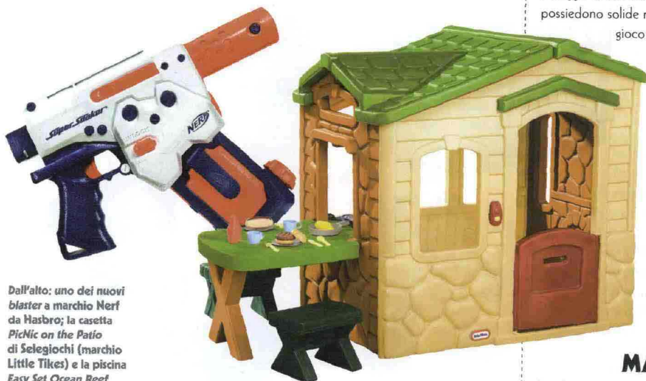
Dall'alto: uno dei nuovi blaster a marchio Nerf da Hasbro; la casetta Picnic on the Patio di Selegiochi (marchio Little Tikes ) e la piscina Easy Set Ocean Reef di Intex, distribuita da Mac Due.

La gamma Little Tikes , distribuita in Italia da Selegiochi , si arricchisce per il 2011 sia di classici articoli in plastica (prodotti con stampaggio a rotazione) sia di nuove altalene in legno da uno e due posti. Oltre a queste ultime, i prodotti di punta per la prossima stagione saranno: Altalena Bilancia , Sabbiera in legno e Casa del Picnic . Con Altalena Bilancia , due bambini giocano rimbalzando a turno e cercando, attraverso i movimenti, di segnare il punto con la pallina del labirinto centrale. L'altalena è in plastica resistente e poggia su una base centrale gonfiabile e le due sedute possiedono solide maniglie per aumentare la sicurezza del gioco. Sabbiera in legno è caratterizzata da bordi arrotondati, appositamente studiati per essere utilizzati come seduta per il bambino e per garantire massima sicurezza. È inclusa una copertura in poliestere e una base in polipropilene impermeabile per evitare l'umidità. Casa del Picnic , infine, è una casetta con tavolo esterno apribile. All'interno si trova una cucina con fuochi, forno e caminetto; sulla facciata una porta con campanello funzionante (sei diversi suoni) e una fessura per le lettere. Completano il gioco 19 diversi accessori tra cui piatti, bicchieri e posate.