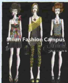
Milan Fashion Campus

Sogni di diventare un nome nel mondo della moda? Comincia da qui: Corso Orientamento Moda - per giovani dai 14 ai 18 anni in "Fashion Design & Photoshop". Impari a praticare il disegno moda a mano libera & computer, approfondire il fashion design con persone esperte nel settore. Tempo 4 settimane dal 13 al 24 giugno, costo 400 euro.