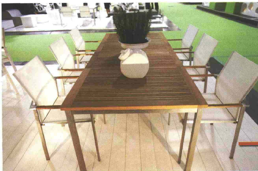
Si ringrazia per le immagini di arredo esterni Sun di Rimini

Nel corso di questi ultimi anni quale risposta commerciale a questa effettiva richiesta di arredo per esterni, ma anche quale programmata strategia di mercato per stimolare nuovi gusti, nuovi bisogni, nuove mode, si è assistito a un fiorire di proposte allettanti, frutto di design innovativo e di tecnologia d'avanguardia, realizzate spesso con materiali inediti. Esperti del settore, aziende specializzate, ma anche non pochi avventurieri si sono gettati nella corsa verso l'Eldorado del nuovo business, progettando, inventando, realizzando magari con materiali e forme del tutto nuovi, sdraio, panche, tavoli, divani, tende, ombrelloni, séparé, pareti vetrate, outdoor cooking, etc. Se poi si aggiunge la filiera degli articoli per il giardinaggio vero e proprio, il computo dei prodotti per l'outdoor living e per il