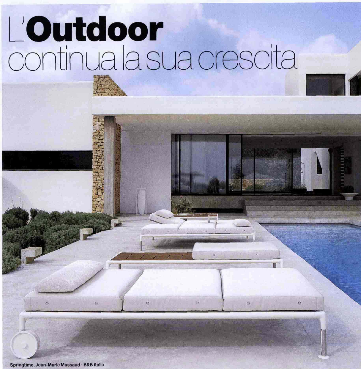
Springtime, Jean-Marie Massaud - B&amp;B Italia

Una ricerca di SUN, il Salone Internazionale dell'Esterno (in programma a RiminiFiera, dal 14 al 16 ottobre), conferma il trend positivo di un settore di sempre maggior interesse per produttori e rivenditori di accessori, arredi e prodotti per la cura del verde