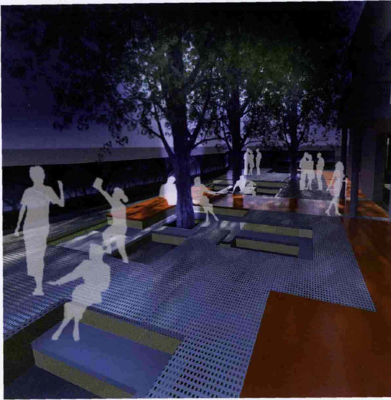
Innaturale di Drawn Together. Innaturale by Drawn Together.