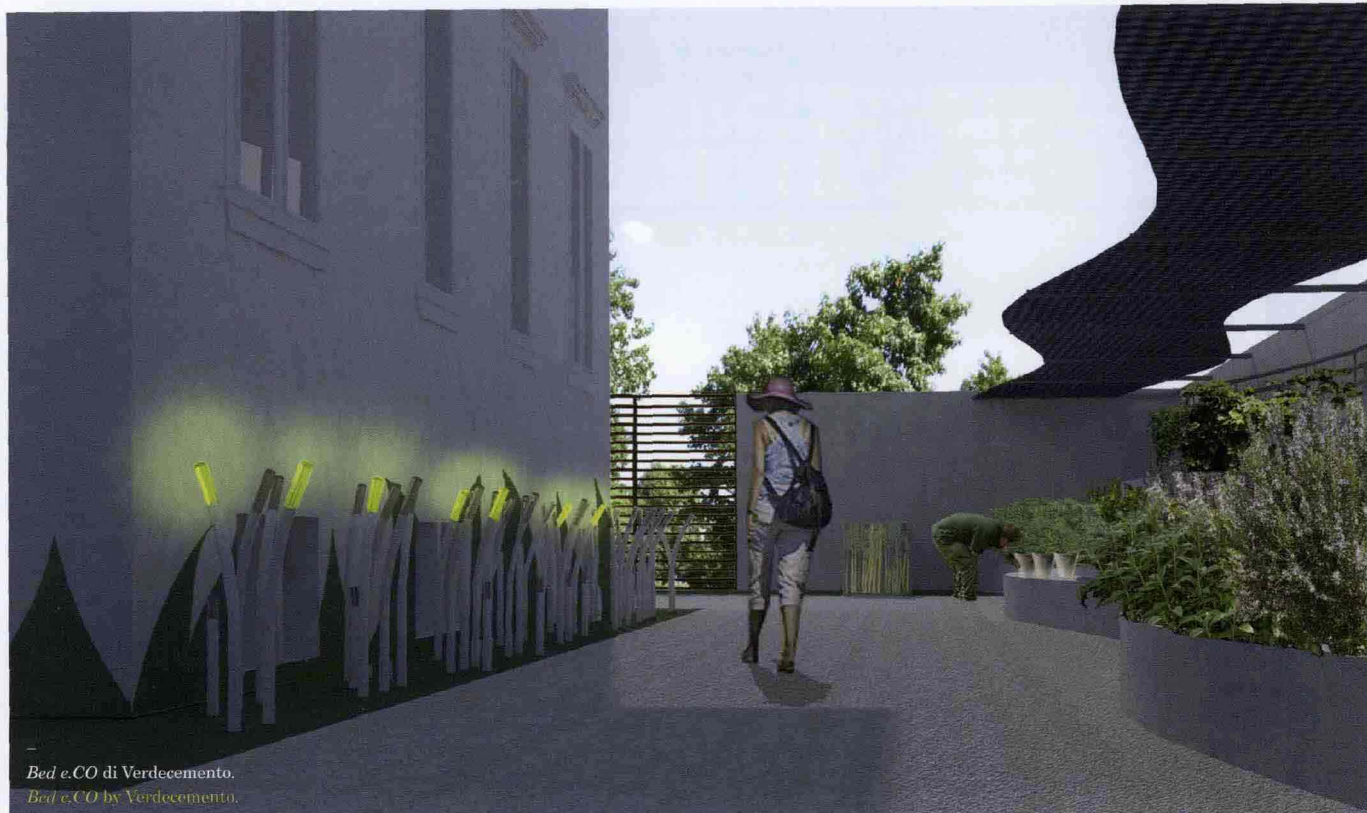
Bed e.CO di Verdecemento. Bed e.CO by Verdecemento.