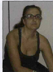
Ariadna Taverna, Verdecemento, bed e.CO.