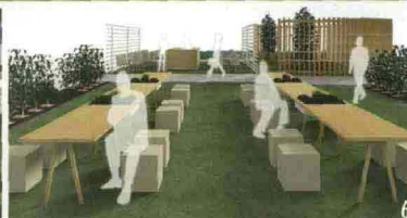
5. LA CASA DEGLI SGUARDI. Firmato da Luca Scacchetti, il progetto del prefabbricato vuole essere tutt'uno con l'ambiente esterno; ha arredi su misura ( www.misuraemme.it ) e un orto urbano. 6. NATURAL LOUNGE. Uno spazio di ritrovo con orto dove discutere tra profumi di salvia e timo, coltivazioni di pomodori e insalata. Di Ilaria Marelli Studio ( www.hsdesign.it ).