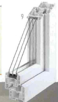
MADE 9. NUOVI PROFILI. Profondo 86 mm, Geneo® in pvc assicura elevati livelli di isolamento termico e acustico. Di Rehau, rehau.it 10. RAYMACIG. Pannelli radianti caldo-freddo. Di Messana ( messana.it ) e Gyproc-Saint-Gobain ( gyproc.it ).

zione di spazi abitativi di qualità . Al Made sarà allestita la mostra Social Home Design 2011 con quattro installazioni (due case prefabbricate, una natural lounge e una Spa condominiale) progettate da architetti e designer. Grande spazio verrà dato al tema dell'ambiente con l'iniziativa AAA Agricoltura, Alimentazione, Architettura legata al costruire green . Per la prima volta