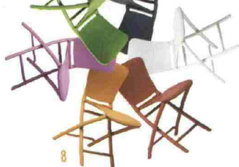
SUN 7. AL RIPARO. Isola Fly, struttura autoportante in alluminio. Il telo, grazie alla forma angolata, permette lo scarico dell'acqua. Di Gibus, gibus.it 8. SALVA SPAZIO. Zac è una seduta in polipropilene in sette colori. Di Nardi, nardigarden.it