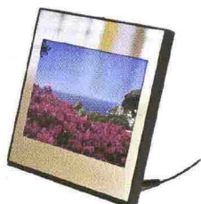
FOTO DIGITALI/ DIRETTAMENTE IN CORNICE

Dall'8 al 10 ottobre, a Bastia Umbra (Pg), seconda edizione di Klimahouse Umbria. Format itinerante dell'importante manifestazione promossa da Fiera Bolzano per divulgare la cultura dell'efficienza energetica e della sostenibilità nell'edilizia attraverso materiali, tecnologie, concept e progetti alternativi (sopra, l'Elios Residence di Perugia, che utilizza in massima parte energia ricavata da fonti rinnovabili), la fiera ospiterà 130 espositori su 5.000 metri quadrati.