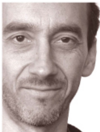
Matrioska Paolo Ulian Italy

U na piccola divagazione sul concetto di impilabilità delle sedie in plastica può dar vita a una poltroncina che tutti noi abbiamo sfiorato ma che non sapevamo di avere in casa. La sua struttura, composta dalla sovrapposizione delle singole sedie, diventa un naturale ed efficace elemento decorativo che caratterizza la poltroncina. All'occorrenza può essere scomposta in dieci parti per offrire ai nostri ospiti altrettante sedute di altezze diverse.