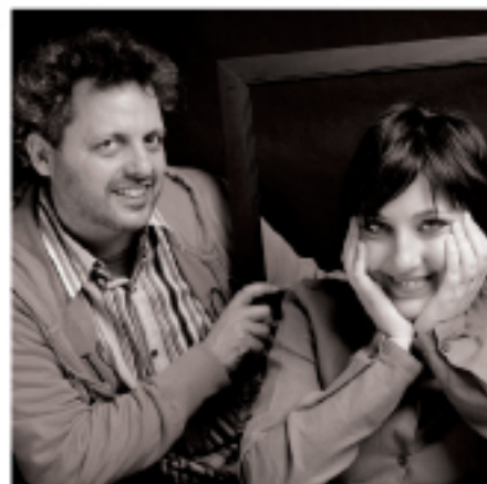
Adele Gumdesign Italy

U n nuovo modo per poter godere della terra, dell'erba; per sentire la natura sulla pelle, seduti in giardino all'ombra di un grande albero o in un parco pubblico. Stavolta comodi e senza mal di schiena! Le vecchie sedie da giardino in ferro battuto, rinnovate e destinate ad un uso trasversale per rafforzare la funzione di "contatto" tra uomo e natura. Il prototipo è stato realizzato dall'azienda CODAL.