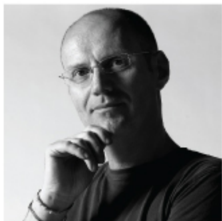
Vasombrella Roberto Giacomucci Italy

V asombrella è la combinazione di un sottovaso per piante e un portaombrelli. Goccia dopo goccia l'acqua piovana dell'ombrello bagnato cade nel contenitore sottostante e confluisce nel sottovaso, l'acqua raccolta è pronta per dissetare le radici. Il prototipo è stato realizzato in terracotta dai maestri artigiani di Fratterosa.